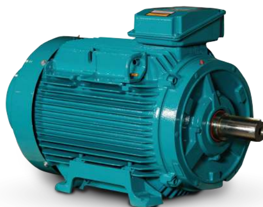
SILNIK OGÓLNEGO PRZEZNACZENIA W OBUDOWIE ŻELIWNEJ