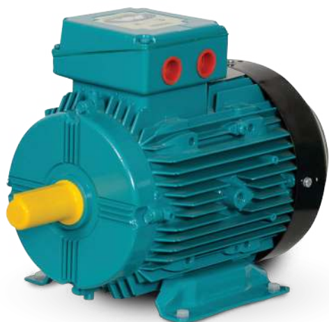
SILNIK OGÓLNEGO PRZEZNACZENIA W OBUDOWIE ALUMINIOWEJ